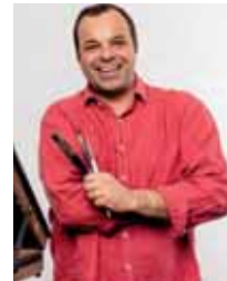
Ari de Goes Jr @aridegoesjr